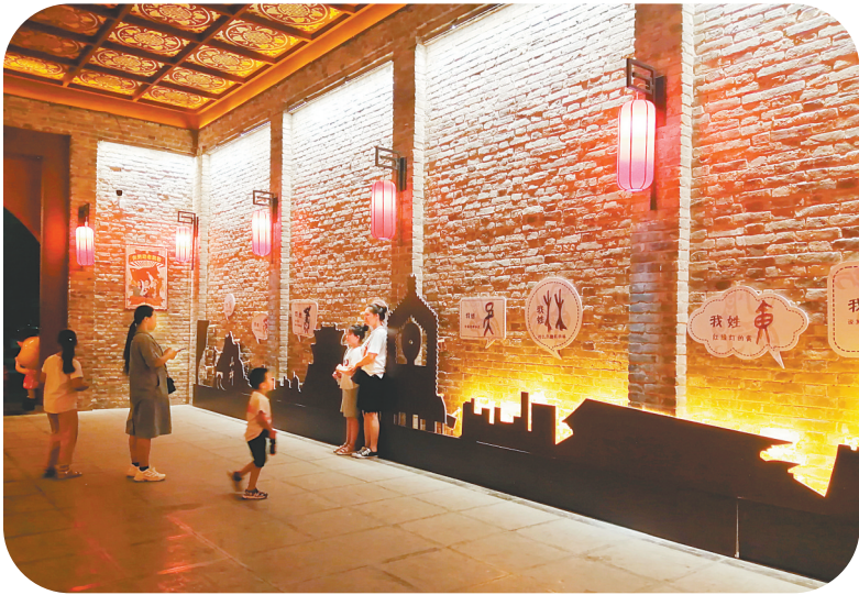
市民在仓巷街拍照留念