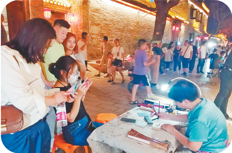
“扇子奶奶”现场泼墨创作

通明,记者看到街市上人流量依然很大,市民有的三三两两结伴购物,有的则扶老携幼出门消夏。周边的西钟楼巷、唐子巷、文峰南街、文峰北街等处热闹程度丝毫不减半分。有的店铺还采取了各种促销活动吸引消费者。“这么多年,北大街一直是安阳人夜晚出行的好去处,也是城市中人气较旺的夜市之一。”一位市民对记者说,之前彰德文化街的夜市也很热闹,有关部门不妨好好规划,开放更多富有特色的夜市,引入更多新业态,让夜市带动夜经济活起来。 “漂亮的油纸伞。”“试试汉服吧,可以租借拍照,也可以出售。”“想要什么造型的糖人,都可以现场制作。”在老城古巷,有的在欣赏街上的手工艺品,有的穿上汉服取景拍照,还有的就是为了赶场儿看热闹。老街唤起了人们久远的记忆,带给市民另一种生活。“工作了一天,约上朋友出来一起逛逛,不但可以放松心情,还可以增进友谊,就是看看这热闹的街景,坐在水边品尝美食,看看霓虹闪烁、感受夜风吹拂,也十分惬意。”市民李娜对记者说。