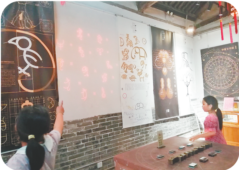
开放的夜间博物馆吸引市民参观