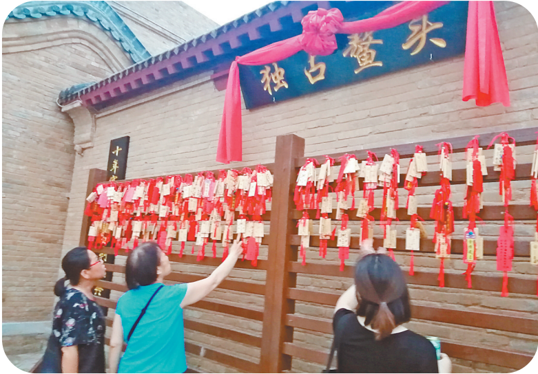
祈福墙吸引市民驻足