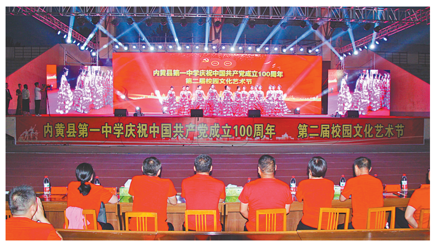
内黄一中校园文化艺术节演出

此外,内黄一中还组织党员志愿者走进东庄镇第一小学少年宫,开展“重温党史 筑梦未来”结对帮扶活动;召开老