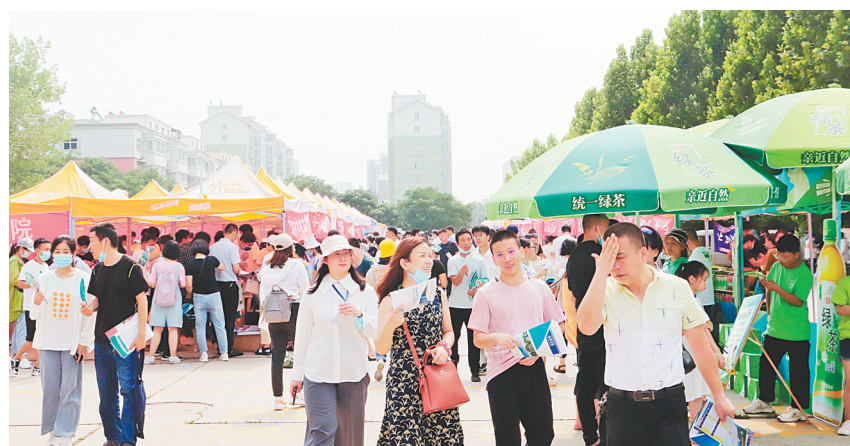
咨询会现场人流如织