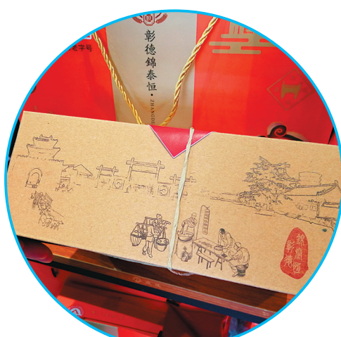
包装上的安阳文化元素

采访中,很多网友表示,文化自信是更基本、更深沉、更持久的力量。在时尚产品中融入传统文化元素,不仅增加了时尚产品的文化魅力,同时也继承和发展了传统文化。他们希望,将来有越来越多的行业、企业、社会团体关注中华优秀传统文化,让传统文化元素更多地融入日常生活,期待在安阳,国潮文化也能越走越远。