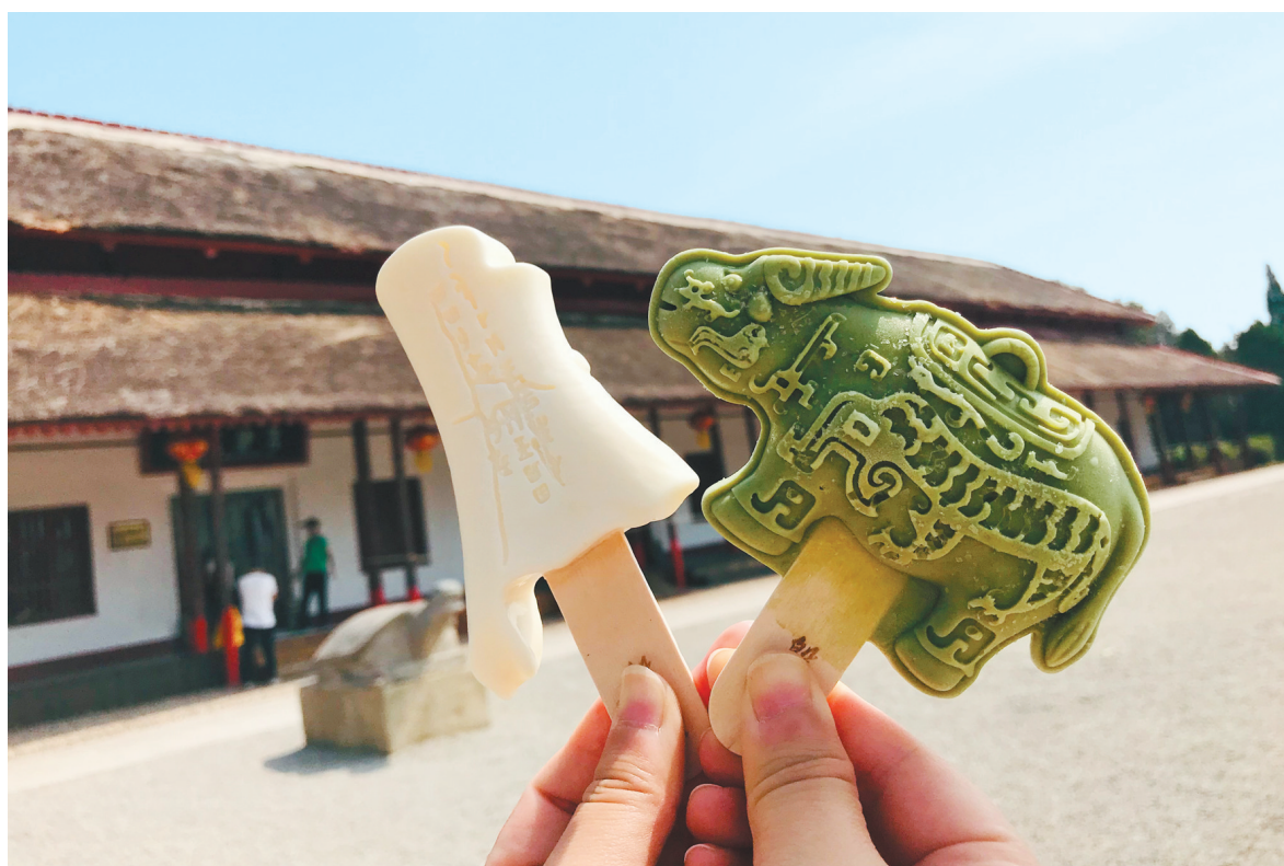
安阳文创雪糕亮相殷墟景区