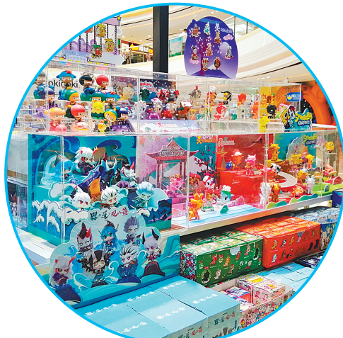
商场里富有“国潮”元素的盲盒