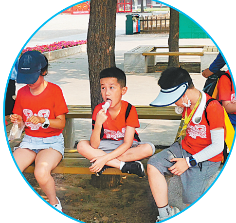
殷墟景区内,游客在品尝文创雪糕