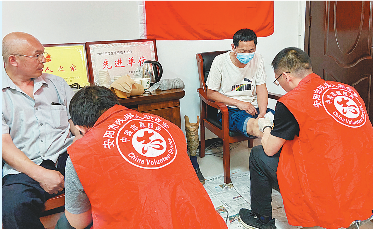
市残疾人辅助器具服务中心党支部开展“过政治生日,忆入党初心”主题党日活动和“我为残疾人办实事”相结合,让全体党员增强了对党组织的归属感,强化了党性意识和宗旨意识,激发了荣誉感。