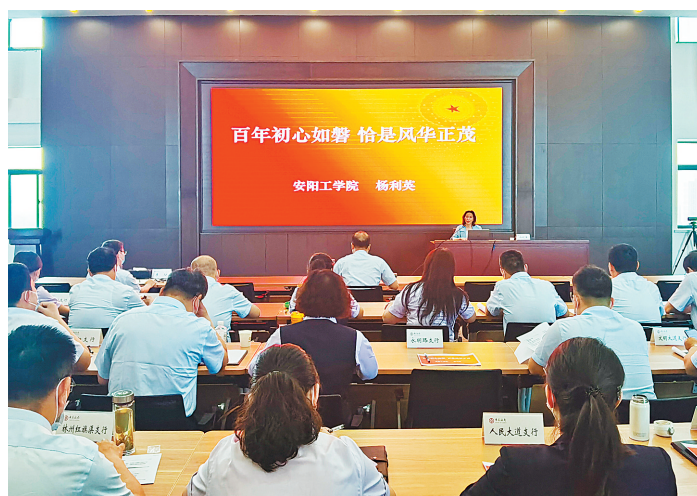
培训现场

中行安阳分行党委委员、纪委书记海滔表示，本次专题培训班是党史学习教育的重要环节，进一步提高了党员干部