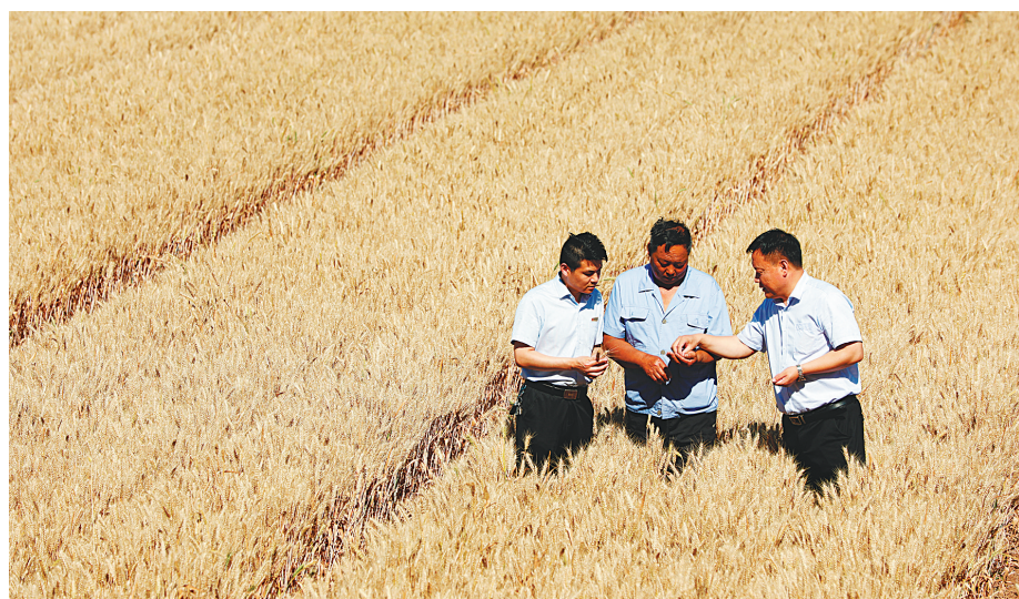
工作人员在城关镇田间查看小麦长势

为确“三夏”资金足额到位，内黄县农村信用合作联社开展了“贷款百日营销竞赛”活动，多方吸收低成本存款，千方百计清收逾期贷款，想方设法筹措资金，保证了“三夏”支农资金的足额到位。“为方便农户贷款，我们在各村设立了普惠金融公示牌，介绍了五类贷款品种。这五类普惠性质的贷款额度从5万元至50万元，根据农业生产周期，贷款期限设定均在3年至5年，产品呈现额度高、期限长、利率优、还款