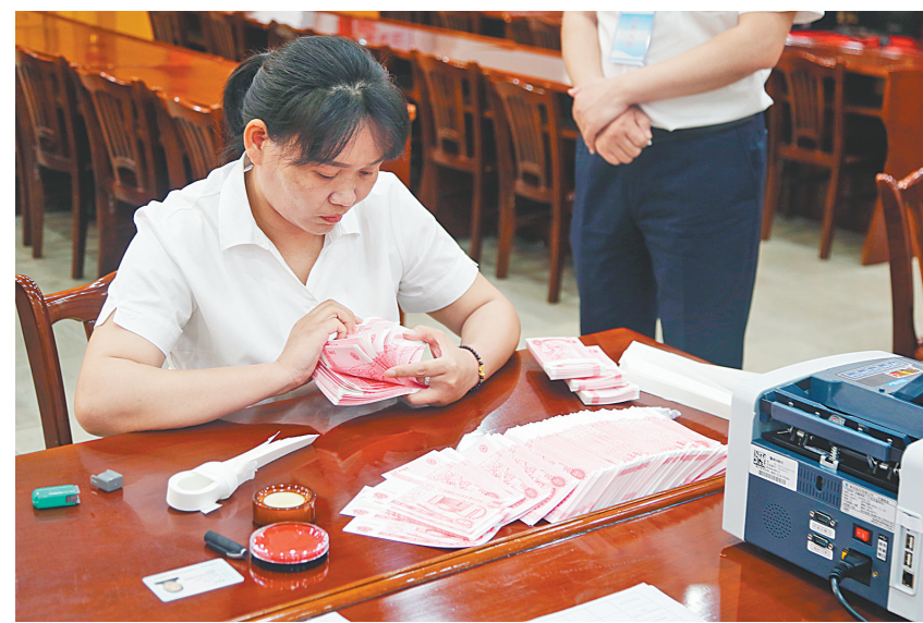
职工技能比赛现场