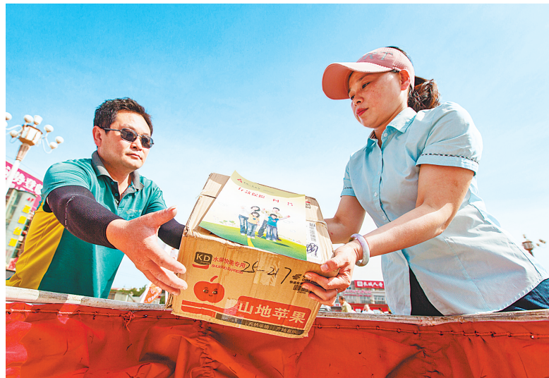
工作人员转交粘贴有存款保险知识宣传单的快递包裹