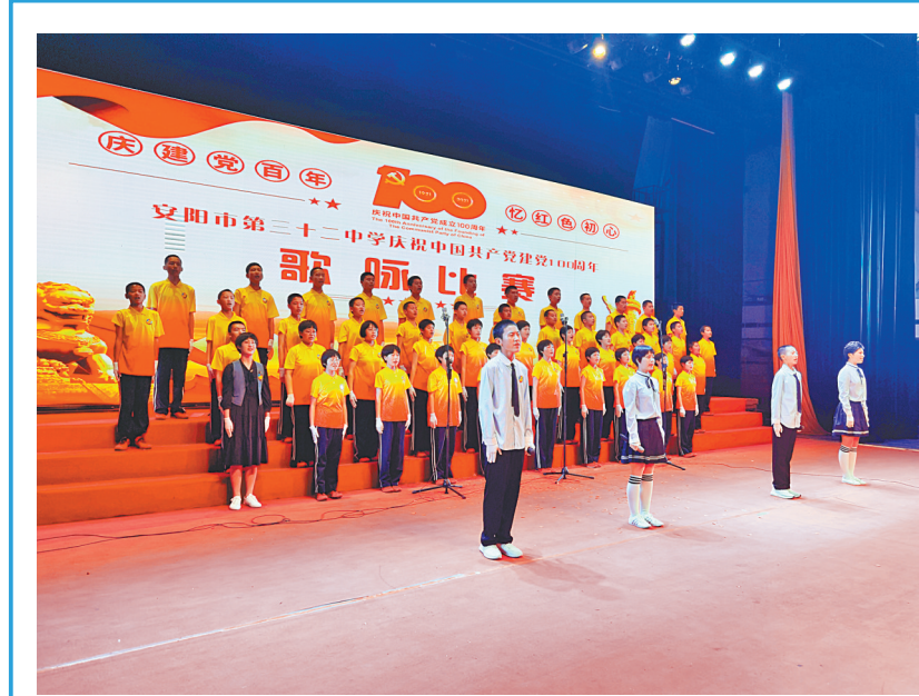
为纪念五四运动102周年,日前,市第三十二中学组织七、八年级学生开展了“庆建党百年,忆红色初心”红歌接力唱暨歌咏比赛活动,引导广大学生同唱红色歌曲,共抒“五四”情怀。庆建党百年,建功新时代。

光阴荏苒,白驹过隙。随着学校办学规模日益扩大,办学条件持续改善,师资水平逐步提升,教育质量蒸蒸日上,市龙安区第二初级中学这所历经半个多世纪沧桑的老校踏着新时代的节拍,必将焕发更为蓬勃的生机。