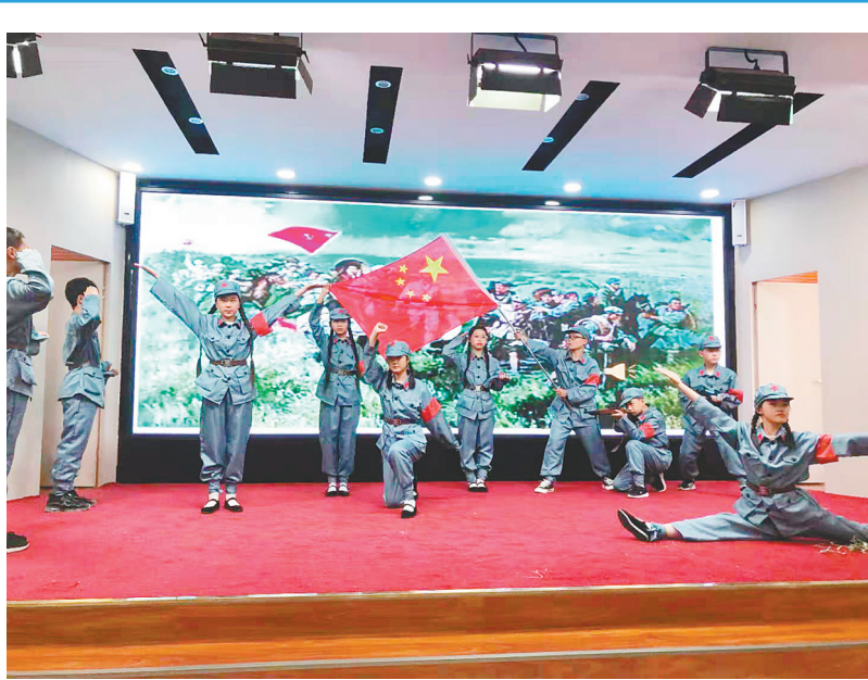
为创建良好校园文化,营造浓厚书香氛围,大力推进“书香校园”建设,高新区实验小学4月份开展了征文大赛、演讲比赛、课本剧演出、图书超市等一系列活动,全面提升学生的读书品质,引领学生成为知识渊博、性情通达、思维创新的新时代好少年。图为4月29日,该校学生在进行课本剧表演。