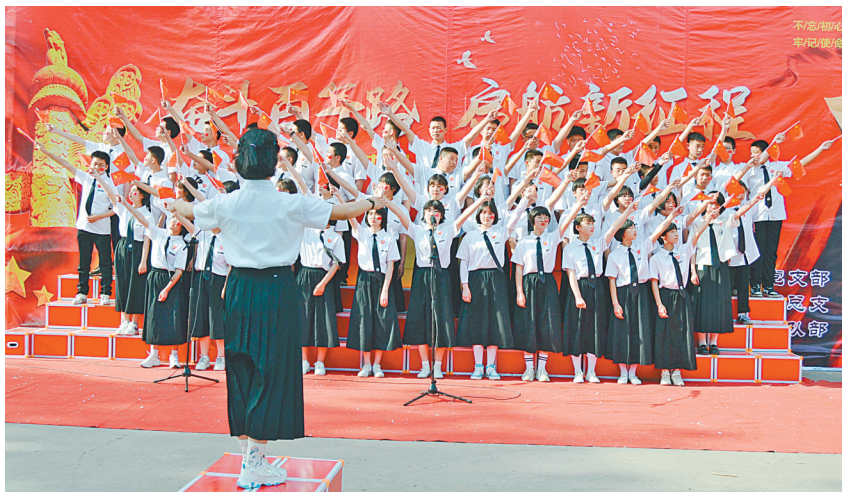
4月30日下午,市龙安区第二初级中学举行迎“五四”新团员入团暨红歌比赛活动

“我校党支部每一名支部委员都冲在教学一线,发挥党员先锋模范作用,无私奉献,学党史、增信念、做表率、当先锋、抓管理、提质量,带动全体教职工积极工作,推动了党建工作和教学工作同步发展,同步提升,为学校发展奠定了根基。”该校校长常上书记说。