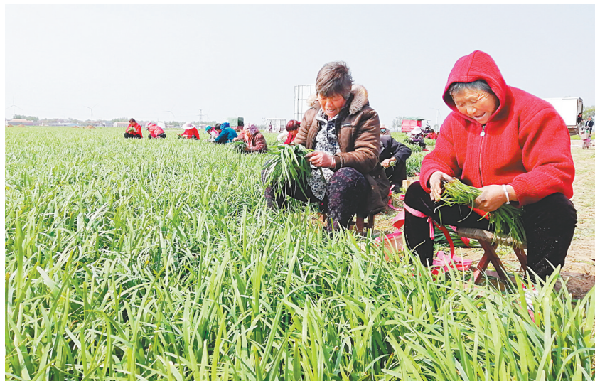
村民正在分拣韭菜

“去年村里成立合作社,多亏了银行工作人员帮忙。银行工作人员考察后,主动给我们全村授信。买菜没有资金,银行先后贷款200万元帮助发展,还经常来询问下一步的规划。”崔计