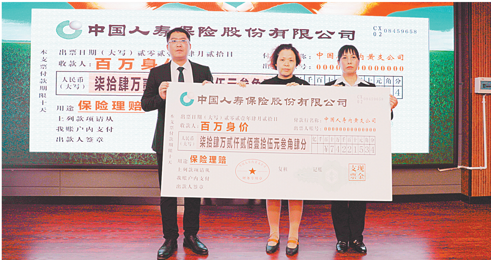
近日,中国人寿保险内黄支公司举行“风险无情 国寿有爱”理赔现场会,对4位罹患大病的患者家属进行了现场理赔。本次给付理赔金共计129.9万元,最高理赔金74万元。4位客户向该公司赠送锦旗,表示感谢。