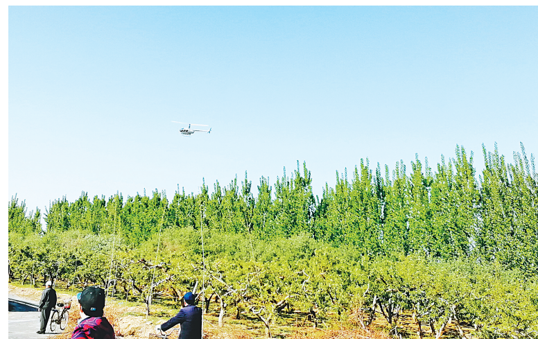
直升机在内黄县后河镇小徐村南地进行春尺蠖飞防作业

本报讯(记者 王都君)4月18日,南林高速公路附近迎来一架R44型直升机,直升机在空中盘旋、撒药,这是我市林业部门正在组织开展春尺蠖飞防作业。