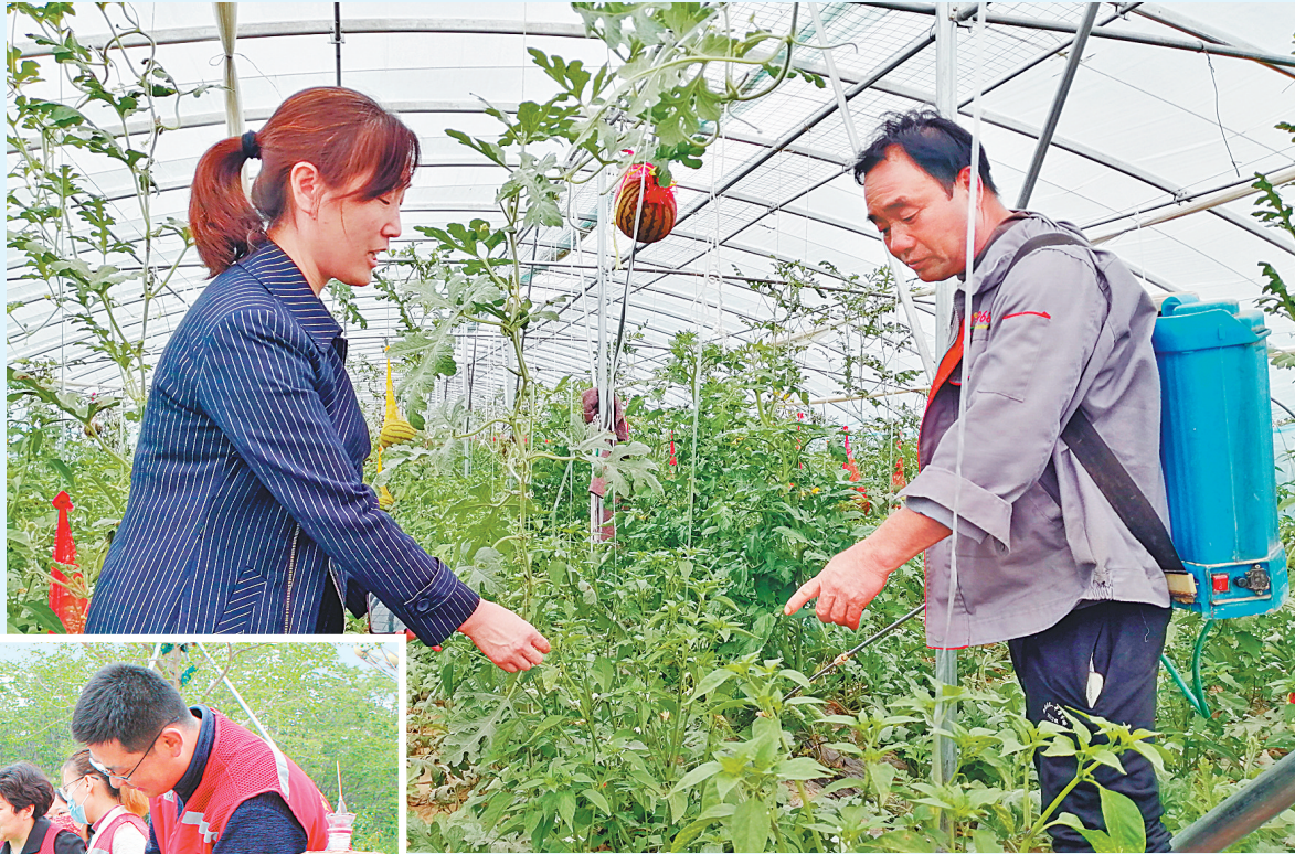
→4月22日,市农业科学院、省“四优四化”科技支撑行动计划红茄所团队到内黄县梁庄镇冯庄村大棚西瓜套种朝天椒生产基地进行技术指导。

展练兵比武活动当作践行以人民为中心的发展思想、落实‘放管服’改革、优化人社营商环境要求的重要举措,自觉把练兵比武活动放到服务创新和人社实践中去落实,当作展示能力与担当的责任来抓好抓实。”该负责人介绍。全市人社系统将把练兵比武活动作为“学党史、悟思想、办实事、开新局”的一项重要政治任务来抓,争先创优,不断提高政治素质、业务素养和服务技能,培养更多群众身边的人社“知识通”、业务“一口清”,大力推行“一网、一窗、一门、一次”,不断深化人社领域“放管服”改革,着力解决人社公共服务领域堵点、痛点、难点问题,优化营商环境,持续提高群众对人社服务的满意度,为安阳人社事业新征程、新辉煌再立新功,向建党100周年献礼。