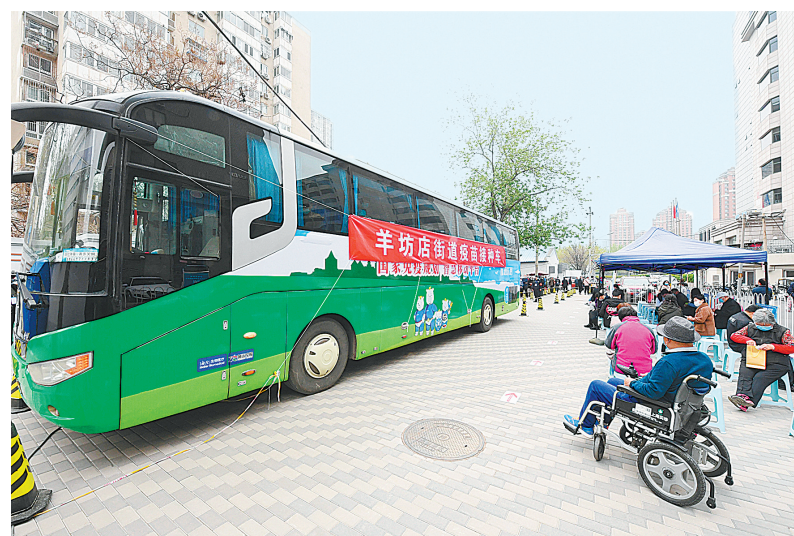
4月11日在北京市海淀区羊坊店街道小厂社区新冠疫苗临时接种点拍摄的移动疫苗接种车。

组委会邀请了国内知名的作家、评论家、文学报刊主编、散文研究专家和出版界人士等担任评委，并设立了初评委员会及终评委员会，最终评出丰子恺散文奖特别奖1名、丰子恺散文奖5名、丰子恺散文奖评委奖10名和丰子恺散文奖提名奖20名。著名作家梁衡以《常州城里觅渡缘》获得丰子恺散文奖特别奖。