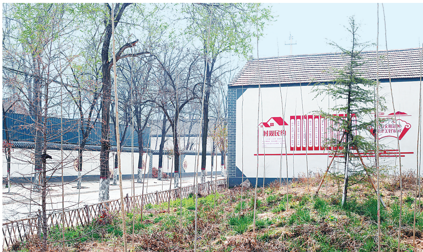
三杨庄村一角

该村积极开展各类生态保护活动,让生态保护的观念深入人心。2019年,全村235户村民全部完成“双替代”。该村设立了生态保护区、水源涵养区。保护区内严禁任何形式的滥砍滥伐、挖沙取土。该村还深入开展水环境治理,设置林业防火检查站,积极实施林木养护、中幼林抚育等工程,增加林业生态资源保有量。如今,三杨庄村绿树掩映着庭