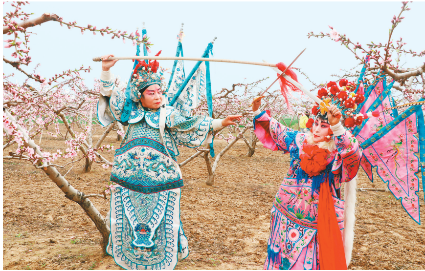
桃园里的文艺节目表演

“我们镇现有桃园近20个品种、100余万株,桃林面积1133公顷,年经济效益超过1亿元。桃花生态旅游已经成为我们镇的一大特色,每年都能吸引数十万游客前来赏花。”豆公镇党委