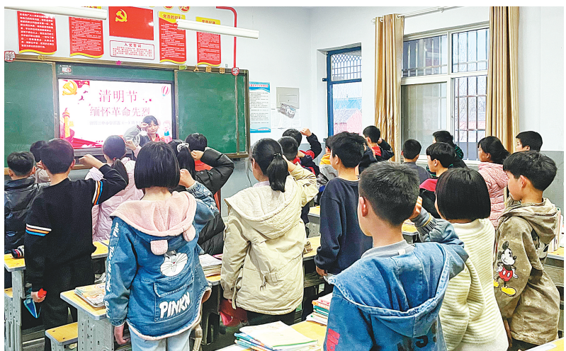
清明节前夕,滑县留固镇第三初级中学(小学部)组织全体小学生开展了“缅怀革命先烈,弘扬民族精神”主题班会活动,教育广大学生缅怀革命先烈,感受民族精神,树立远大理想。

大赛按民族、美声、通俗三大唱法分组,每组各设一等奖1名,二等奖2名,三等奖3名,颁发奖杯、获奖证书,分别奖励奖金或奖品3000元、1000元、500元;优秀奖10名,颁发奖励证书、纪念品一份;组织奖若干,奖励奖牌。