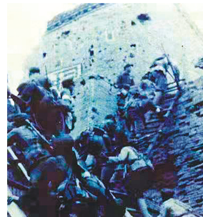
↑攻城战士登上安阳城垣