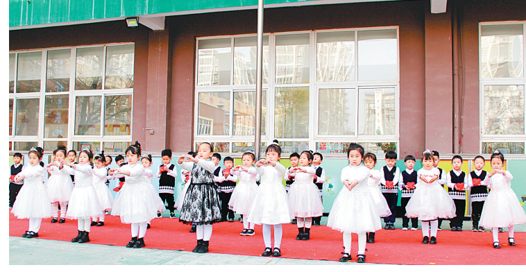
昨天,北关区直幼幼儿园举行了“清明缅先人 礼花献英雄”主题升旗仪式。升旗仪式上,中四班的小朋友及其家长表演了精心编排的诗词朗诵和舞蹈,使小朋友了解了清明节的含义,感受到了中华文化的魅力。该园定期举办升旗仪式,给幼儿在全国师生面前提供了展示自我的平台,提高了他们的自我表现能力,成为他们社会性发展的一个舞台。

史专题讲座。欧健从“为什么要学中国共产党党史”“百年党史的苦难辉煌”“百年党史的深刻启示”等方面作了深入阐述。两家单位开辟的“线上共享”新课堂,增强了党史学习教育的时效性和吸引力,激发了大家学习党史的活力。安阳烟草工商企业长期坚持协同发展,通过现代视频技术手段,实现了市烟草专卖局与安阳卷烟厂会议、讲座、培训的共享模式,致力于提升跨单位、跨区域沟通和协作效率,有效节省了人力、物力、时间等成本。