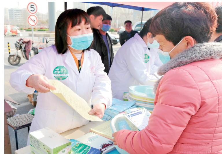
宣传活动现场

本报讯(记者 张武杰 通讯员 李纪法)为动员全社会积极参与加强结核病预防控制工作,使结核病能及时诊断和规范有效的治疗管理,早日彻底消灭结核病,3月24日,在第二十六个“世界防治结核病日”来临之际,内黄县卫健委在全县开展了“世界防治结核病日”大型宣传义诊活动。