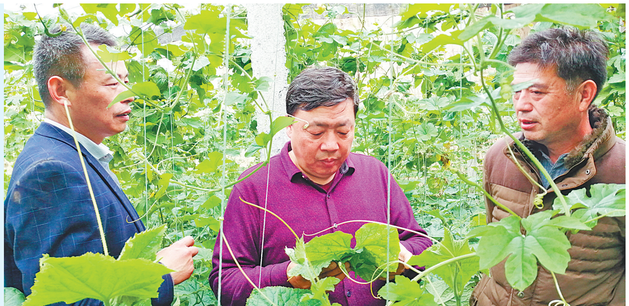
—3月14日至15日,河南省大宗蔬菜产业技术体系团队、省农业科学院园艺研究所、市农业科学院在内黄县梁庄镇召开“设施黄瓜标准化栽培与产业化经营模式示范与推广”观摩会,进一步推动我省设施黄瓜栽培技术的发展,提升黄瓜产业化水平。 图为3月15日,省、市专家对温室大棚黄瓜栽培进行技术指导。