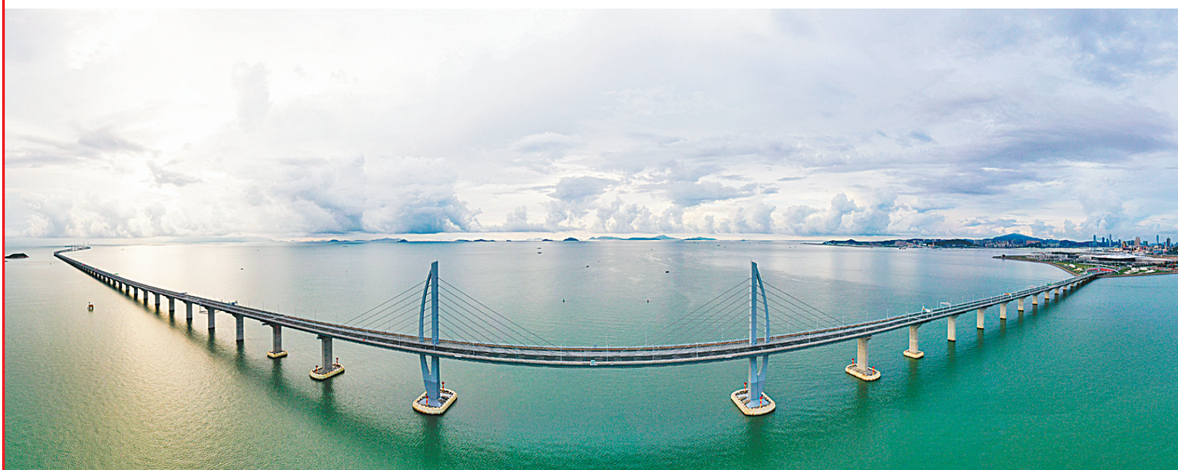
这是2020年9月12日拍摄的港珠澳大桥(无人机全景照片)