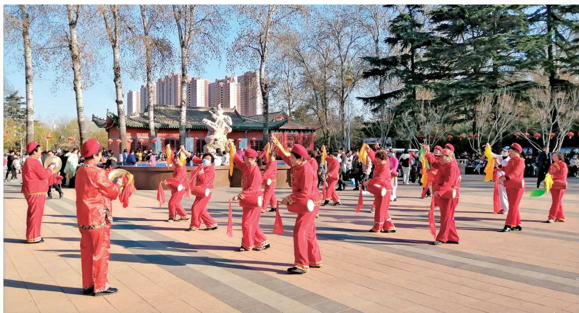
春节期间,市人民公园内游人如织,腰鼓表演吸引众多游客驻足观看。