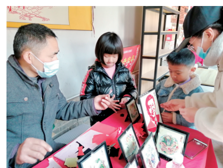
在县前街,市民体验传统剪纸文化。