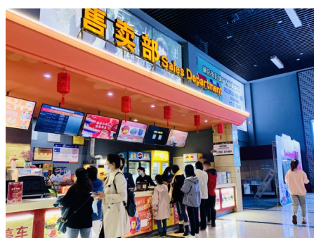
在我市一家电影院里,市民正在排队购票。

采访中,很多网友表示,“云过年”成为特殊情况催生的春节新年俗,“云过年”减少了与外人的接触,助力了疫情防控,年味儿也有了时尚感。