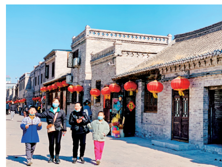
春节期间,市民热衷本地游。