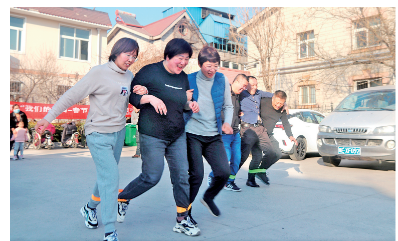
2月19日下午,安阳市生态环境局北关分局组织干部职工举办了拔河、跳绳、绑腿跑、抢凳子等项目在内的趣味运动会,增强了团队凝聚力。图为活动现场。

下一步,红旗路街道将会把严格管理干部和热情关心干部结合起来,使党员干部安心安业,心情舒畅,充满信心,积极作为,敢于担当。