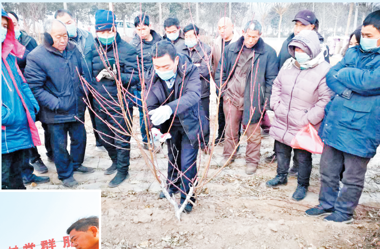
→为了推广果树种植技术,使林业科技真正服务广大果农,1月22日,滑县林业总站组织林业技术人员在城关镇南苗园村开展送科技下乡活动,向广大果农现场示范桃树、梨树等果树冬季修剪技巧,并就果树施肥、病虫害防治、浇水等方面注意事项进行了讲解和指导。(姜丽萍 摄)

据了解,近年,四间房镇以“孝德工程”建设为载体,积极开展形式多样的精神文明创建活动,有力推动了各项工作的顺利开展。该镇每年都会开展“两好两孝”模范评选和表彰活动,旨在进一步弘扬社会主义核心价值观,倡导文明新风,提升德治水平,培养良好的家训、家教、家风,在全镇营造见贤思齐、崇德向善的浓厚氛围,使广大群众的思想道德素质和社会文明程度逐步提高。