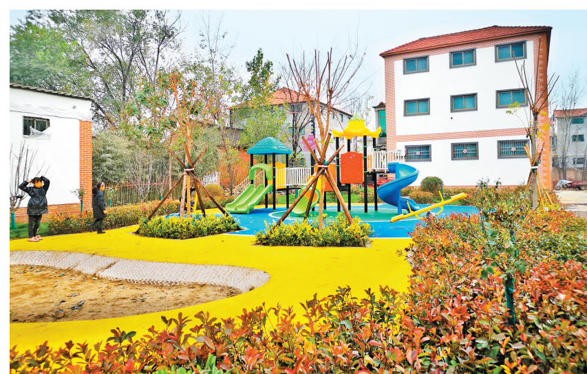
西苑村村内建设的游园广场

“下一步,我们将继续坚持以习近平新时代中国特色社会主义思想为指引,严格按照‘产业兴旺、生态宜居、乡风文明、治理有效、生活富