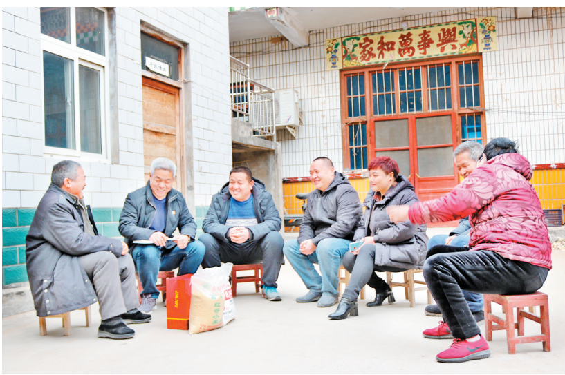
村“两委”干部走访慰问贫困户

1月15日,对小屯村来说是一个重要日子,村“两委”换届工作圆满完成。如今的小屯村,环境美了,“两委”班子团结了,群众心气儿顺了,邻里之间互敬互助,“两好两孝”不断涌现,文体活动健康发展,文明乡风正悄然形成。村内胡同硬化、村民文化广场建设、种植结构调整、招商引资……正当村民忙着迎新年的时候,2021年的工作规划在燕国营的脑海中逐渐清晰起来。