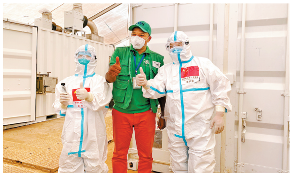
2020年9月2日,在几内亚首都科纳克里一个核酸检测采样点,中国抗疫医疗专家组成员与当地工作人员合影。