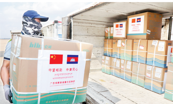
2020年3月23日,在柬埔寨首都金边,机场工作人员搬运中国援柬医疗物资。