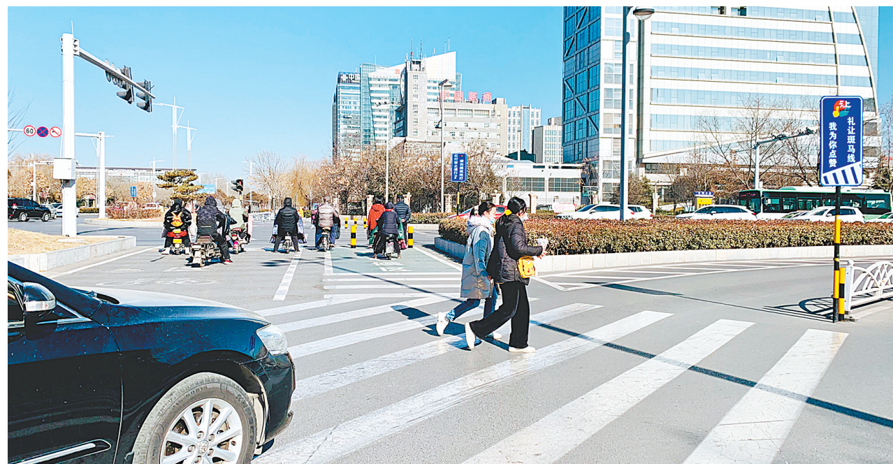
机动车礼让行人