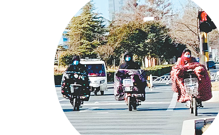
有市民闯红灯