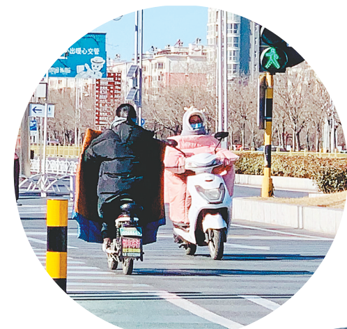
有市民进行

采访中,很多网友表示,如果公交车上的每位乘客都能做到讲文明、懂礼让、守规定,那么公交车就会变成一道亮丽的文明风景线。