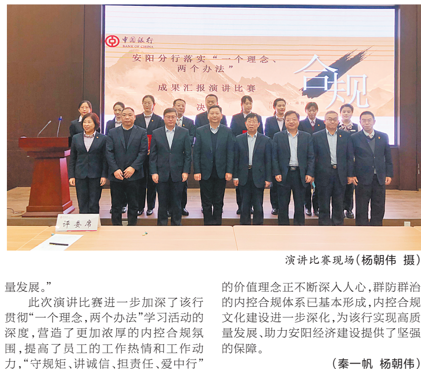
演讲比赛现场

本次主题演讲比赛吸引了60余名选手参赛,经过前期预赛,最终来自中行安阳分行各分支机构的10名选手站上了决赛的舞台,他们立足自身岗位,声情并茂地讲述了在全行开展“一个理念、两个办法”贯彻学习活动中,员工以落实“六稳”“六保”要求,持续做好普惠金融工作,为实体经济、小微企业、乡村振兴注入金融“活水”,推动事业发展的生动感人故事。决赛现场气氛热烈,参赛选手群情激昂,声情并茂,展现出了中行员工干事创业的精气神,回答了“如何实现高质量发展”的重要命题,为全场100余名观众呈现了一场精彩的盛宴。