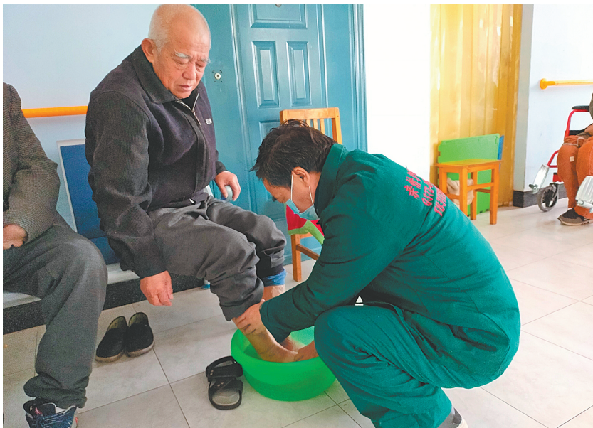
在白璧镇卫生院托养中心,护工为入住的老人洗脚

能、半失能或精神智力残疾的特困人员619人,均已签订供养协议书。其中,分散供养的有500余人,集中供养的有100余人,重度精神残疾人集中托养的有10余人。