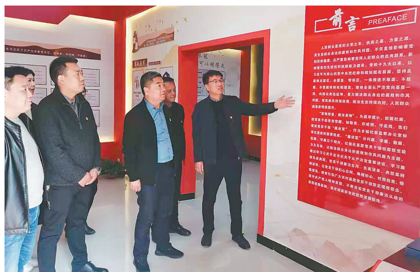
崔家桥镇干部学习政策进行“廉政体检”

该镇纪委监察办公室从工作实际出发,立足监督职责,实施“乡级纪检监察机关+监察专员+监察信息员”片区联系机制,将全镇44个村划分成4个片区,每个片区配备1名监察信息员,每个片区由1名监察专员联系,监察专员监督片区内各村党支部履行全面从严治党主体责任情况,强化对村纪检委员会和监察信息员的领导,加强与村务监督委员会的协作与衔接。同时,为强化村级纪检委员、村务监督委员会对村级党务村务的监督作用,该镇纪委制定实施《崔家桥镇村