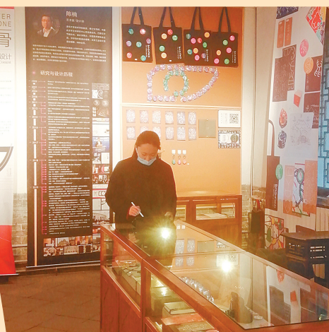
创意礼品店,商品琳琅满目