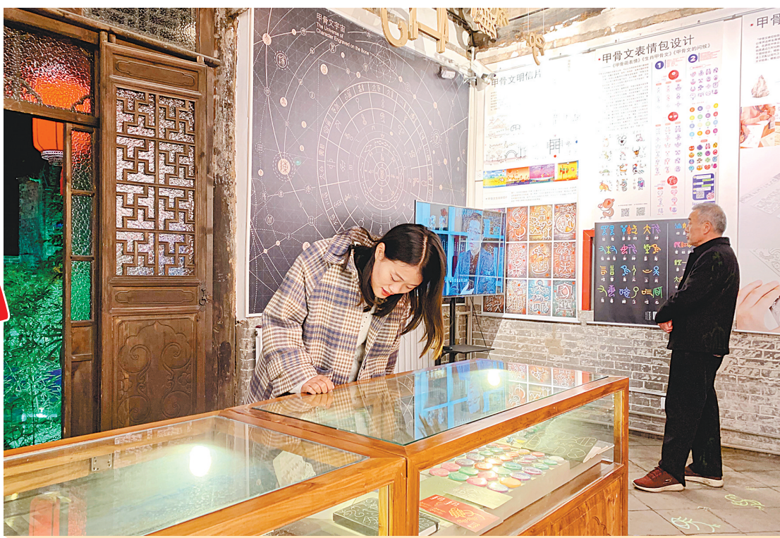
游客在仓巷街挑选礼物