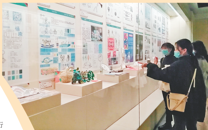
中国文字博物馆吸引年轻人“打卡”

采访中,不少网友都表示,城市礼物打造的不仅是文创产品,文旅的所有相关产业也可以和文创进行联系,整合文旅资源,以文化创意为核心,进行产业联动,提升产业的总体价值,毕竟,好的文化创意会让游客留下美好记忆。