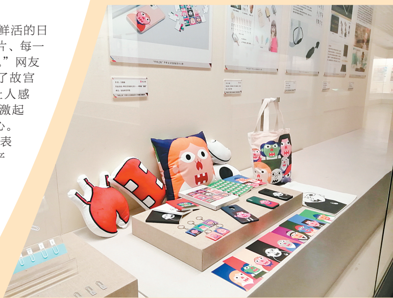
甲骨文文化创意作品展示

网友“抱抱熊”表示,一个城市的文创产品不仅要有地方特色,还要有包容性,既可以像一张书签、一副象棋那样,满足普通百姓的喜好与需求,也可以高大精深满足一些专业藏家的收藏需求。