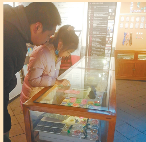
创意纪念品惹人喜爱