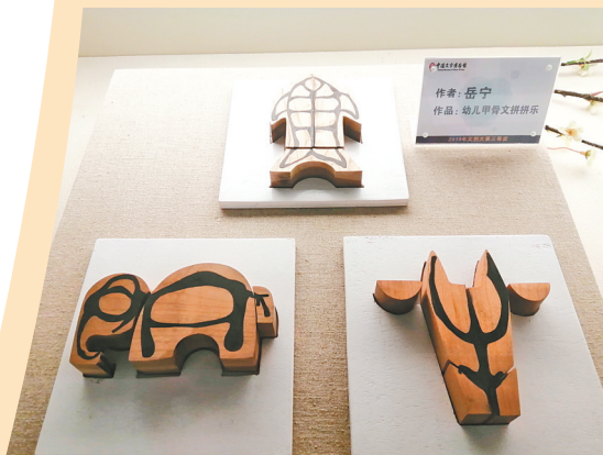
幼儿甲骨文拼拼乐