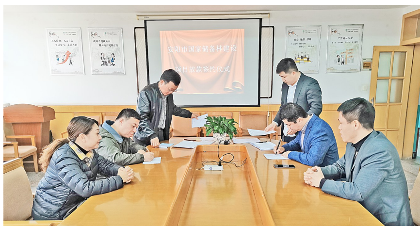
签约仪式活动现场

同政府出资方代表共同组建项目公司——安阳市景欣生态林业有限公司,主要负责安阳市国家储备林建设PPP项目的建设、运营和维护。项目总投资59.744亿元,拟申请金融机构贷款47亿元。 5月2日,农业银行安阳市区支行正式收到安阳市景欣生态林业有限公司7亿元项目融资贷款申请。8月31日,安阳市国家储备林建设PPP项目7亿元贷款获中国农业银行总行审批通过。9月19日,中国农业银行安阳市区支行成功投放安阳市国家储备林建设内黄县子项目工程款1600万元。10月29日,又成功投放安阳市国家储备林建设汤阴县子项目工程款1.111亿元,为我市国家储备林建设PPP项目的顺利实施提供了坚实保障。(牛瑞卿)