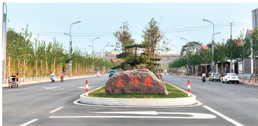
林州市太行路南延一景

11月12日,记者来到位于林州老城区的人民街采访。这条街承载了许多林州市民的美好记忆,有该市第一座