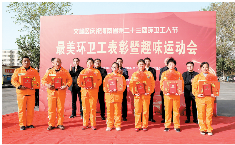
“最美环卫工”表彰现场

今年10月26日是河南省第二十三届环卫工人节。当天上午,记者走近他们,了解他们的工作,感受他们的动人故事。