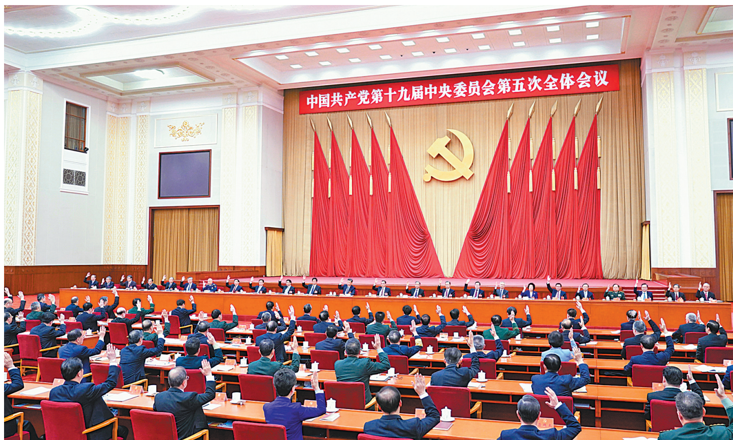
中国共产党第十九届中央委员会第五次全体会议,于2020年10月26日至29日在北京举行。中央政治局主持会议。