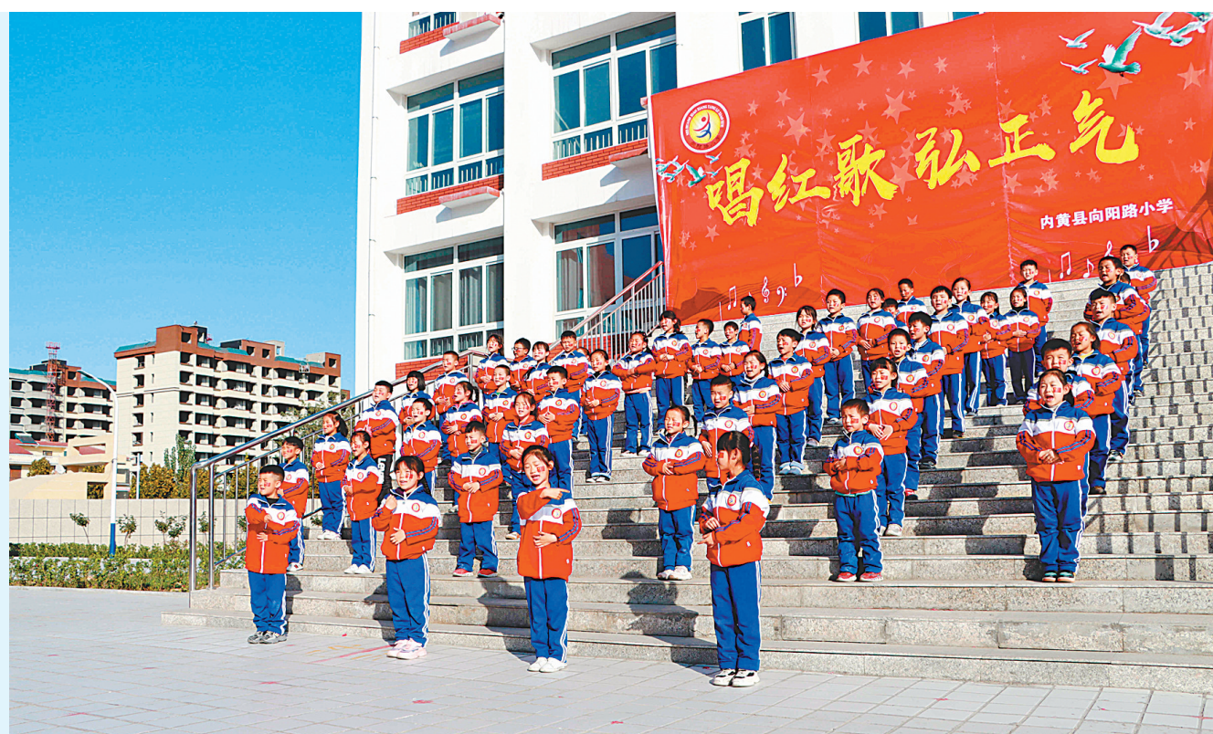
10月27日，内黄县向阳路小学举行“唱红歌弘正气”歌咏比赛。全校1349名学生以班为单位，身着红色校服组成“中国”“心”等图案，以不同形式高声同唱《国家》，通过歌唱洗涤心灵，弘扬正能量，激发师生们内心的爱国情怀，让孩子们从小树立爱国主义思想，立志努力学习，长大成才后报效祖国。(刘院军/文)