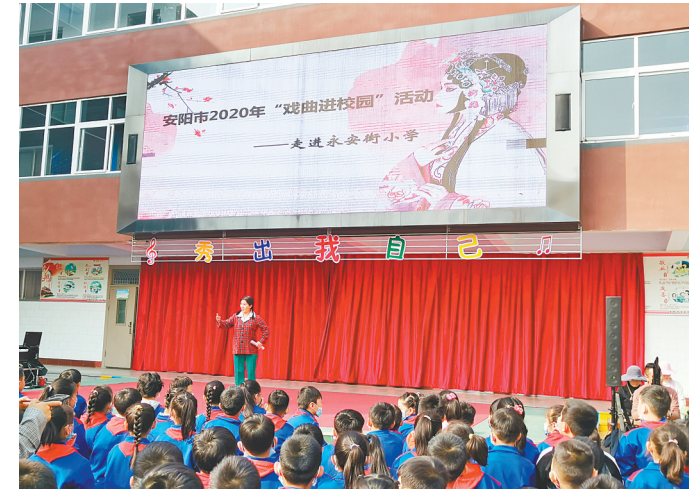
10月26日，我市2020年“戏曲进校园”活动走进永安街小学，市豫剧团的艺术家们为同学们带来了精彩的戏曲表演。此次活动弘扬了社会主义核心价值观，传承了中华优秀传统文化，大力推动了中华优秀传统文化在学校的普及和传播，提高了学生的艺术修养和文化素质，丰富了学生的课余文化生活。

“献血者是用自己的热血去挽救患者的生命，无偿献血是一种美德，是人道主义的体现，彰显了献血者助人为乐的情怀。我们希望更多人加入无偿献血志愿者的行列传递爱心。”市第六中学负责人表示。