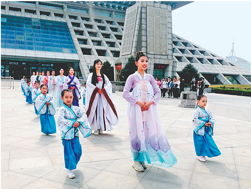
昨天12时30分，在市“两馆”广场，一场古韵十足的汉服快闪表演活动吸引了不少市民观赏，为当天开幕的第十二届安阳航空运动文化旅游节助力。当天的活动以走秀和舞蹈的艺术表现形式，展示民族服饰的传统美感，给现场群众带来了一场穿越时空的体验，沉浸于华美的唐风气息之中，领略文化融合之美。

5G无人机的发展提供示范引领和窗口，安阳具备成为国内首个“5G低空自由飞”之城的地利优势。 “人和源于安阳市委、市政府对低空产业、低空技术的大力支持，为我们提供了便捷优质的服务，让我们对项目的落地和发展更有信心。”王湘宁表示，希望安阳规划好低空产业布局，利用好优势资源，将低空产业打造成一张新的城市名片，与3000多年的璀璨历史交相辉映。