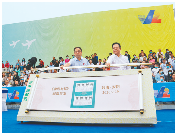
《鼎鼎有铭》邮票首发

题、航空题材、河南题材、安阳题材和经济建设等主题邮集，方寸之间演绎历史风云，再现新时代辉煌成就，彰显中原文化深厚底蕴，描绘安阳美好未来。