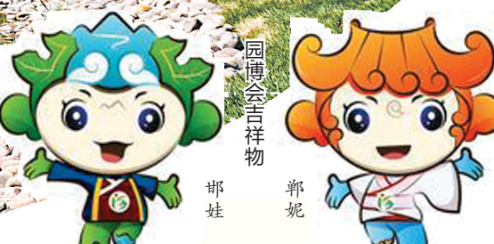
园博会吉祥物 郭娃 郭妮

主打工业风的展园,用含苞待放的月季造型,对烟囱外立面进行装饰,形成螺旋上升的建筑,夜晚结合夜景点亮,寓意工业绽放的文明之花。走进一个地市园,如同走进一座城市。各展园气势恢弘,主题鲜明,各具文化特色,美不胜收。