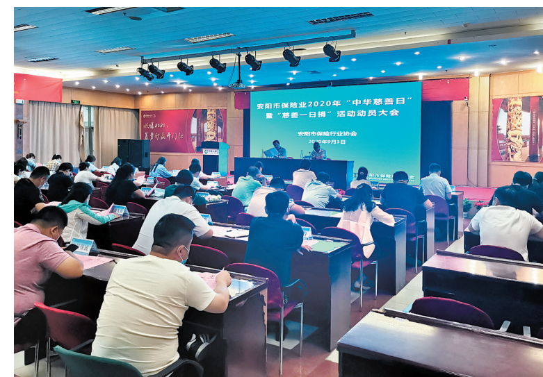
动员会现场

本报讯(记者 田丹丹)在第五个“中华慈善日”,为贯彻落实我市2020年“中华慈善日”暨“慈善一日捐”活动方案,在保险业营造浓厚的慈善氛围,9月3日下午,市保险行业协会组织全市56家会员单位举行了市保险业安阳市2020年“中华慈善日”暨“慈善一日捐”活动动员大会。动员大会上,市保险行业协会秘书长李献军传达了安阳市2020年“中华慈善日”暨“慈善一日捐”活动动员大会精神。市慈善总会有关部门负责人开展了“99公益日”活动专项培训。会议最后,李献军要求各公司要高度重视、迅速行动,积极参与“慈善一日捐”活动,要深入发动,加大宣传力度,各级领导要带头捐款,争做积德行善、勇于担当社会责任的保险公司和保险人,为更多需要帮助的困难群众献上保险业的爱心,为全市慈善事业贡献应有力量。