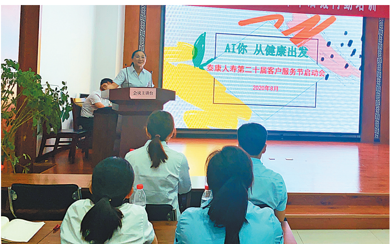
客服节启动会现场

在《我的泰康》个人数据报告活动中,该公司将以24年司庆为契机,利用艺术电影的方式讲述“您”