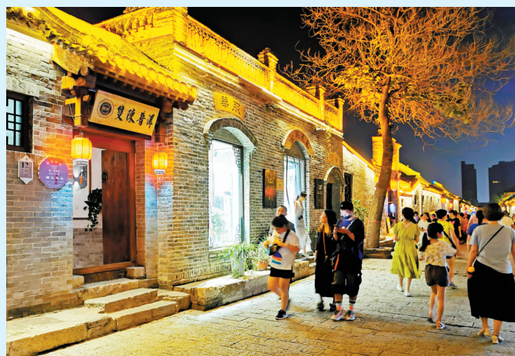
仓巷街夜景

近年,随着市委、市政府把文化旅游作为四大千亿级主导产业重点打造,我市文化旅游逐步加速向高质量发展转变。