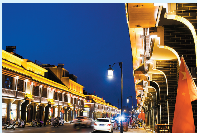
精忠报国城

令人瞩目的是,我市将投资282.816亿元,用于建设20处标示性文化旅游重大项目。