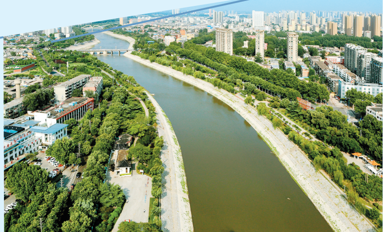
洹河文化旅游带