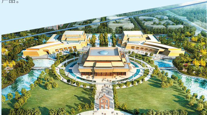
中国文字博物馆续建工程和汉字公园鸟瞰图

促进产业跨界融合,推动文化旅游与工业、商业、科技、康养等融合发展,发展工业旅游、旅游商贸综合体、科普场馆、生态康养旅游、避暑目的地等新型旅游产品。