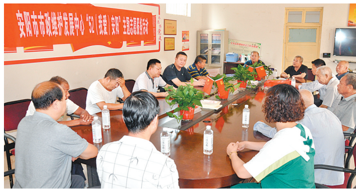
7月15日,市市政维护发展中心党员志愿者10余人赴北关区柏庄镇辛店东街村开展“结对帮扶共建美丽乡村”志愿服务活动。该中心党委书记以上党课的形式与村“两委”一班人就强化党支部建设、锻造战斗堡垒进行了学习交流。

作为省级文明校园,市第六中学一直心系学校周边社区的困难群众。全体师生始终将践行“奉献、友爱、互助、进步”的志愿服务精神作为学校教育教学工作的主线之一,以教育促文明,以文明强教育,教书育人,奉献社会。此次走访慰问,拉近了该校和社区困难群众之间的距离,加深了学校与社区之间的深厚情谊。