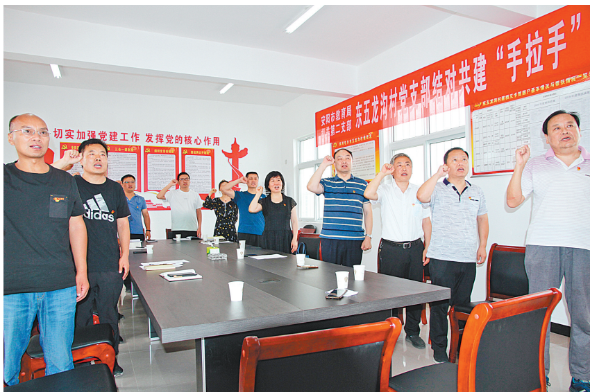
市教育局机关第二党支部与殷都区洪河屯乡东五龙沟村党支部结对共建。图为6月29日,两个党支部的部分党员一起重温入党誓词。

市委办公室第九党支部和第十党支部为共建村党支部协调扶贫资金用于修建道路,为每个家庭检修并更换损坏的水表,购置电表和水泵解决群众浇地难等突出问题。市财政局非税征收中心党支部邀请市农科院专家团到内黄县亳城镇东亳城村开展“手拉手”专家进村、科技下乡活动,10余名农业专家对该村土地进行采样分析并为村民解答辣椒、小麦种植问题。市农业农村局行政第一党支部和行政第二党支部组织农业专家深入结对村开展科技下乡、专家进村等活动。市发改委、市委老干部局积极帮助结对村推进综合性文化服务中心建设,以改善群众的精神文化生活。