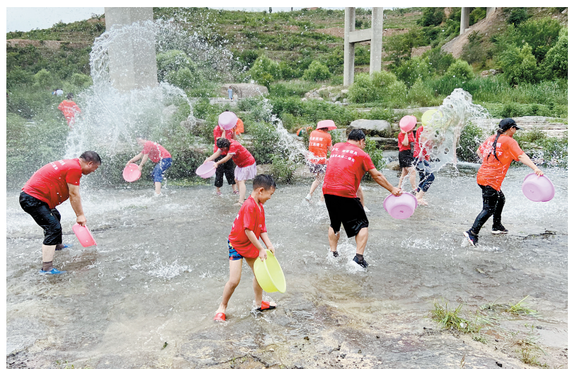
7月5日,炎炎烈日下,几十名“驴友”骑行至五龙镇的淇河河畔。他们拿着水盆、水枪,相互追逐,泼水狂欢,将酷暑燥热一扫而光。

截至目前,横水镇政府工作人员在镇、村共发放宣传页5.7万份,张贴宣传海报60余张,在全镇营造了浓厚的禁毒、防毒氛围。