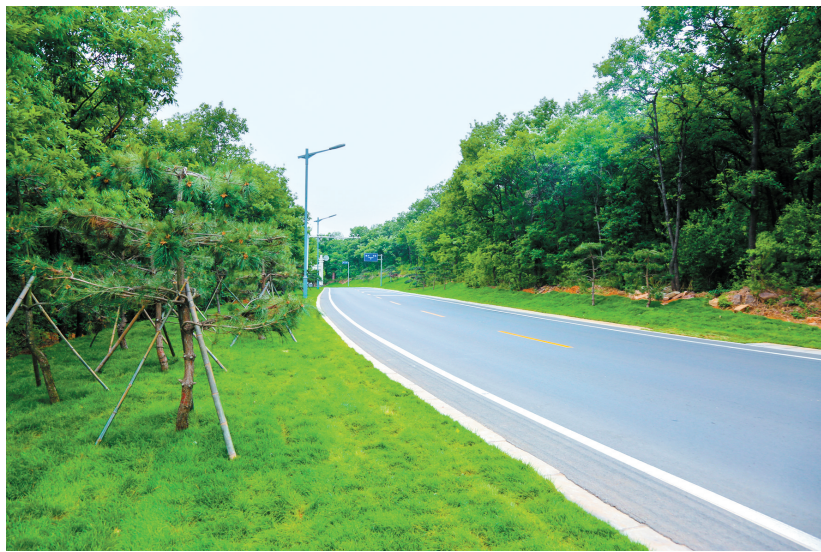
林石公路景色(资料图)

该市还坚持“城乡统筹、以城带乡、城乡一体、客货并举、运邮结合”的运营思路,建立完善农村公路运输服务网络,优先打造中心城区连接周边镇、村庄的“30分钟经济圈”。截至目前,该市拥有营运车辆7022辆,542个行政村通班车率为100%。该市财政每年补助2200余万元,确保农村客运和城乡公交开得通、留得住、可持续。该市建立县级物流分拨中心1个、乡镇物流综合服务网点16个,设立物流综合服务网点542个,有效促进了全市物流业的繁荣,加快了农村脱贫致富的步伐。