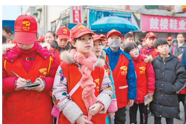
组图图为安阳日报小记者参观钟楼、鼓楼广场(资料图)