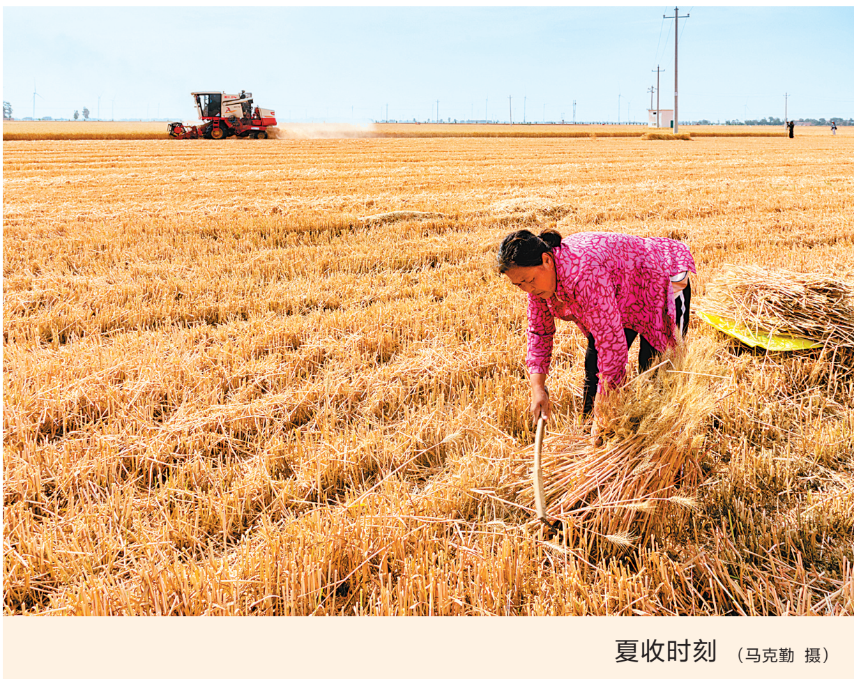
夏收时刻