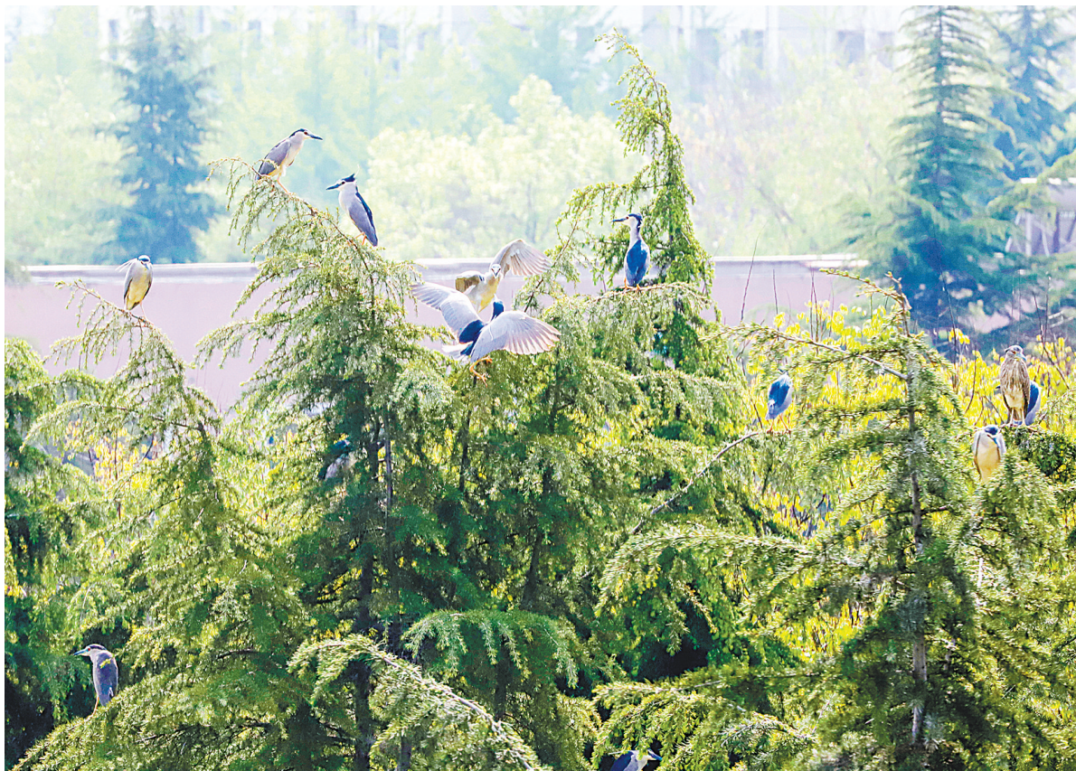
绿叶深处鸟鸣脆