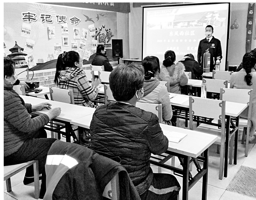
消防安全知识培训现场

本次培训不仅提高了居民，尤其是辖区老年人的消防安全意识，还增强了大家自救自护能力，让大家对学习消防知识的重要性有了更深的了解和认识。