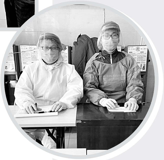
↑为加强“4·15”全民国家安全教育日宣教，连日来，安阳地区医院持续加强疫情防控工作。4月12日，安阳地区医院工作人员坚守在疫情防控一线。

通过持续开展主题鲜明、内涵丰富、形式多样的国家安全宣传教育活动，进一步强化干部群众的总体国家安全意识，形成维护国家安全的强大共识，以新担当、新作为推动中央、省委、市委关于国家安全决策部署落实见效。