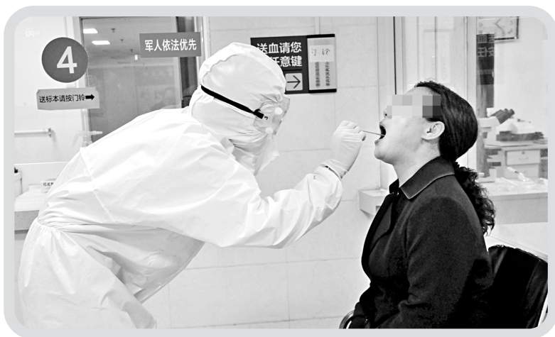
↑面对疫情，市第三人民医院检验科成立生物安全质量防控小组，细化生物安全工作流程，明确职责。对新冠肺炎疑似病例及流感患者的标本采集、分离、运送等，严格按照实验室生物安全防控指南操作，对工作人员采取三级生物安全防护措施，并进行模拟演练。图为近日，工作人员正在采集咽拭子。