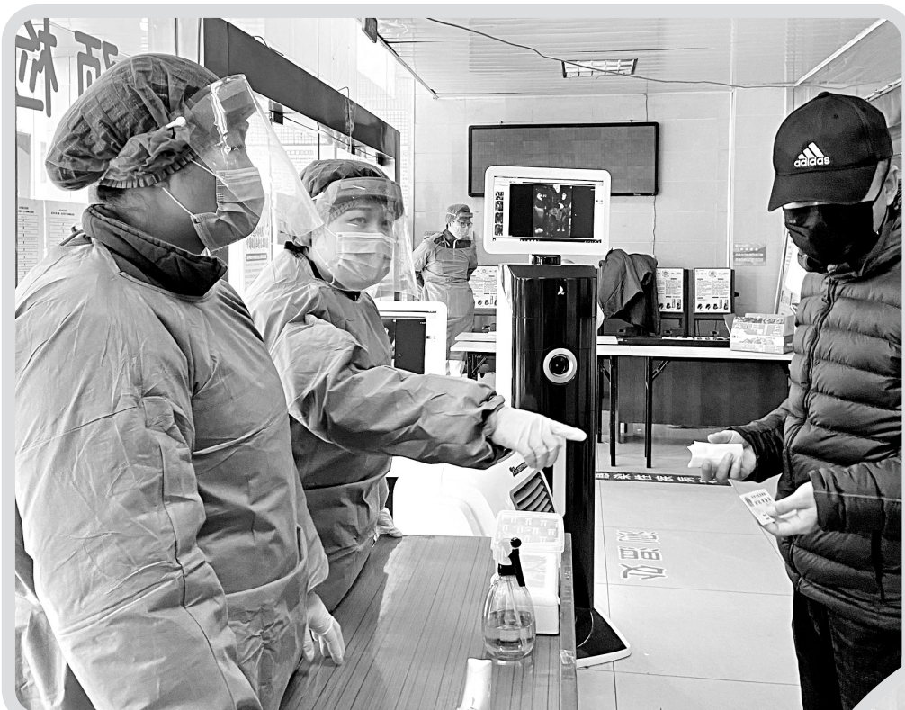
↑4月12日，安阳地区医院工作人员在门诊对入院患者进行实名登记。

今年4月15日是我国第五个全民国家安全教育日。今年的活动主题是“坚持总体国家安全观，统筹传统安全和非传统安全，为决胜全面建成小康社会提供坚强保障”。