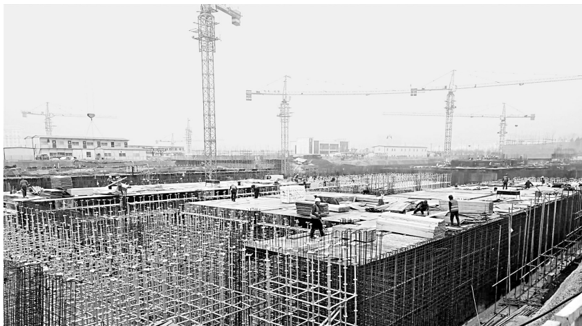
棚户区改造项目现场

春回大地,复工复产正当时。安阳县(示范区)在抓好疫情防控的同时,加大对项目建设进度、质量、安全的督查力度,要求施工单位争分夺秒赶进度,抢回受疫情影响的工期,努力在新县城基础设施、生态宜居、产业集聚、公共服务、承载能力等方面实现突破。县住建局有关负责人介绍,为科学有序推动建筑工地开工,把新冠肺炎疫情影响降到最低,该局制定出台了《安阳县(示范区)有序推进建设工程开(复)工实施方案》《关于房地产开发企业和房产中介从事房屋网上销售人员复工防疫工作的通知》等文件,明确建筑工地复工6个条件,包括疫情防控方案、防疫物资及人员配备,复工人员排摸管控,全封闭式管理,卫生防疫交底,食宿、就餐条件防疫标准以及从严落实返岗人员“5个一律”疫情筛查和工地“4个”防控到位等措施。同时,落实企业主体责任、属地监管责任、行业管理责任。强化参