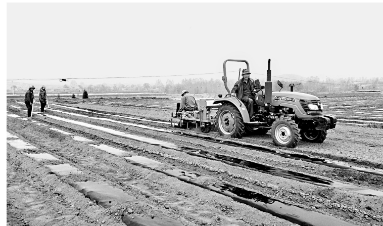
横水镇加大农业结构调整力度,依托后白德旺合作社发展订单农业,规模化种植辣椒,打造农业产业品牌,建设辣椒种植基地,带动各村种植辣椒,力争全镇辣椒种植面积在133公顷以上。图为3月25日,西白村干群群众在该村流转的13公顷辣椒种植基地上起垄覆膜播种。

“这是一支英雄的团队、一支特殊的团队,我们一定会为英雄提供最好的服务,让他们在这里得到最好的放松,留下一段最美好的回忆。”该宾馆住店经理侯晓东说。