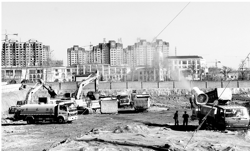
林虑河北段生态治理项目施工现场

中建卓越建设监理有限公司多名监理在现场监督施工,监理代表张鹏伟是林州市合涧镇人。他说:“修建林虑河公园是一个生态工程,是好项目。城市美好了,我们生活的幸福指数将大幅提升。”