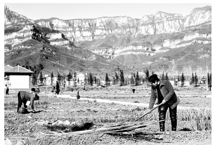
3月17日上午,黄华镇董家村东栗家井自然村的田地里处处是农民辛勤劳作的身影。大家抢抓农时,在田地里种瓜点豆。(本报记者 刘剑昆 摄)

清沙村党支部书记胡志刚在现场算了一笔账:“一亩地平均可以栽种70株花椒苗,进入盛产期后,每株可产干果约6斤,按照市场价每斤35元计算,每亩可收入一万元以上。”花椒收获以后,合作社负责把老百姓种植的花椒统一收集,寻找销路,为种植户解决了后顾之忧。