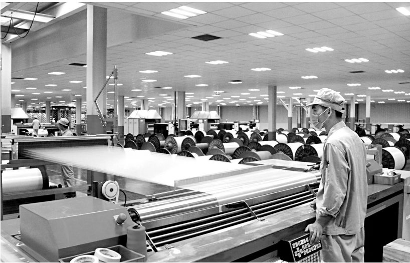
光远新材已建成投运的玻纤生产线

会常务理事单位、覆铜板分会副理事长单位，中国玻纤协会副会长单位，国家高新技术企业，中国电子材料行业五十强企业，河南省创新龙头企业，河南省优秀非公成长创新型企业，被中国玻纤协会授予“中国电子级玻纤生产基地”称号。在林州市委、市政府的指导下，光远电子材料项目作为主导产业项目，经过6年多的快速发展，先后共四期项目点火投产，电子纱和电子布产能与产品等级位居我国同行第一梯队，其2019年四期高性能低介电电子纱项目，前期历经3年多的积极筹备，在研发团队和相关专业院校的合作下，与最强5G技术终端客户签订战略合作协议共同推进，项目填补了行业空白，标志着光远将逐步迈入世界高端电子材料企业阵营。