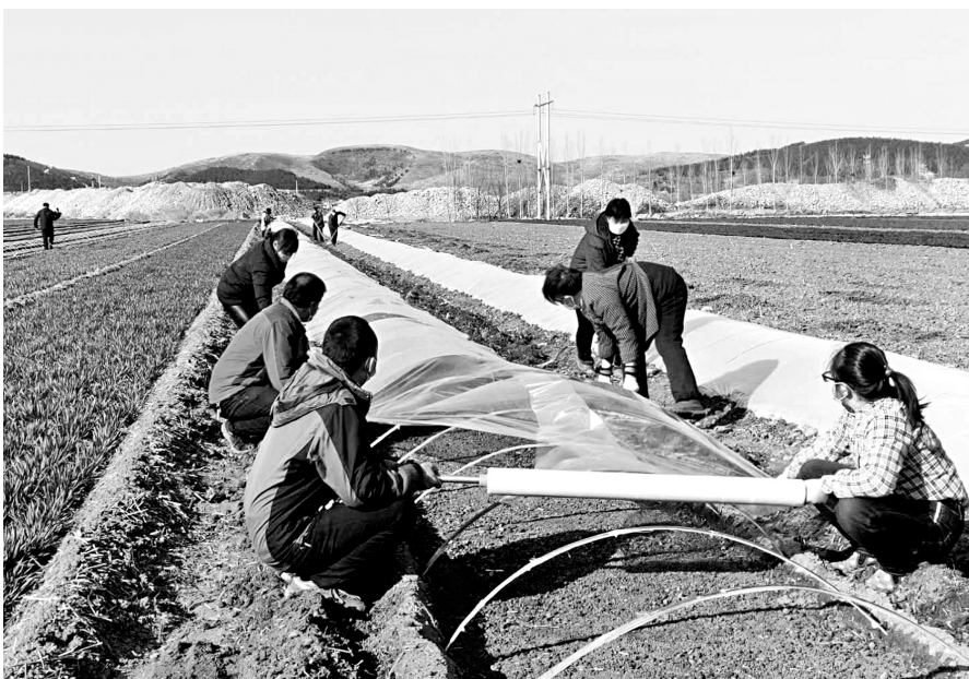
村民正在进行辣椒育苗