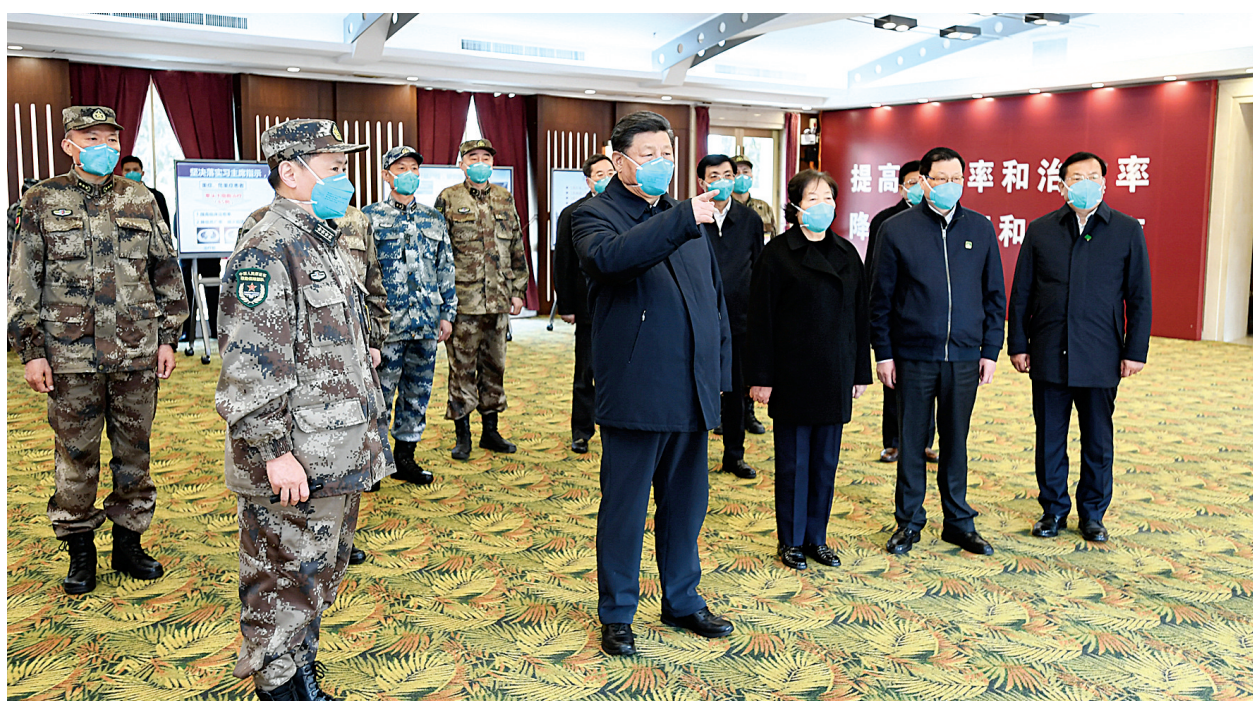
3月10日,中共中央总书记、国家主席、中央军委主席习近平专门赴湖北省武汉市考察新冠肺炎疫情防控工作。这是习近平在火神山医院指挥中心,听取医院建设运行、患者收治、医务人员防护保障、科研攻关等情况介绍。

习近平强调,在这场严峻斗争中,武汉人民识大体、顾大局,不畏艰险、顽强不屈,自觉服从疫情防控大局需要,主动投身疫情防控斗争,作出了重大贡献,让全国全世界看到了武汉人民的坚韧不拔、高风亮节。正是因为有了武汉人民的牺牲和奉献,有了武汉人民的坚持和努力,才有了今天疫情防控的积极向好态势。武汉人民用自己的实际行动,展现了中国力量、中国精神,彰显了中华民族同舟共济、守望相助的家国情怀。武汉不愧为英雄的城市,武汉人民不愧为英雄的人民,必将通过打赢这次抗击新冠肺炎疫情斗争再次被载入史册!全党全国各族人民都为你们而感