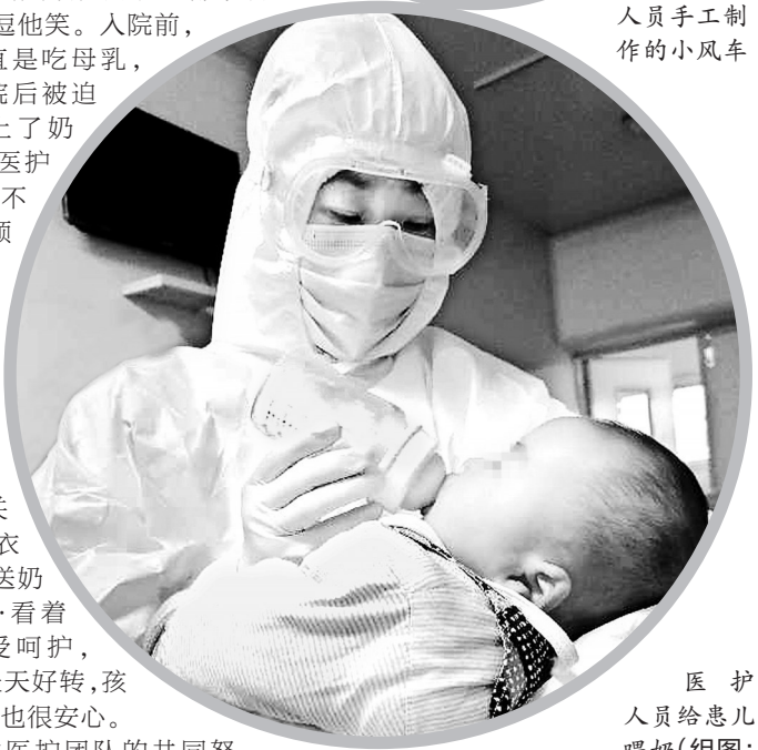
医护人员给患儿喂奶