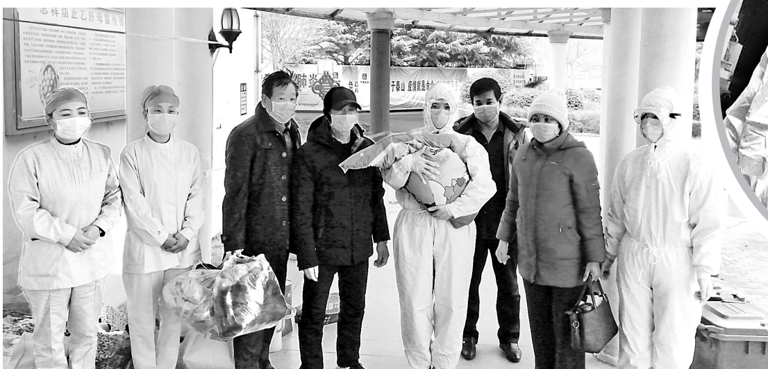
3个月大的婴儿患者出院