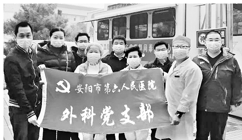
市第六人民医院外科党支部参加献血活动

本报讯(记者 张武杰 通讯员 徐红霞)新冠肺炎疫情突如其来,湖北武汉更是牵动着每一个国人的心。在这段时间里,全国各地纷纷向武汉捐赠防护物资、食品等,更有各地医护人员逆向奔赴武汉疫情战场,与时间赛跑,拼尽全力救治患者。