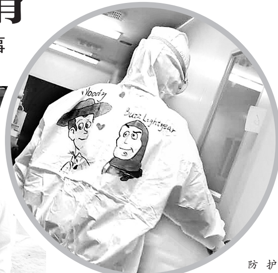
防护服上画上了卡通人物

连日来,孩子的病情持续改善,呼吸道症状消失,连续一周体温正常,肺部炎症吸收好转,各项化验指标显示正常,2月22日、23日,两次