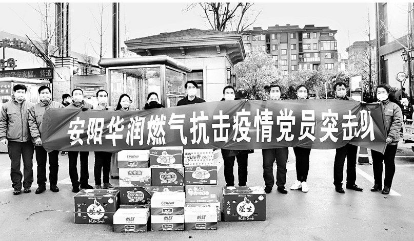
物资捐赠现场

疫情就是命令,防控就是责任。下一步,安阳华润燃气将继续践行红色央企社会责任,抗疫突击队将继续发挥模范带头作用,坚决打赢疫情防控阻击战。