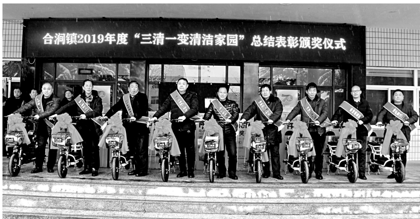
受表彰的先进代表

2019年2月,该镇结合实际,出台《关于开展“三清一变”、整村绿化、逐村观摩人居环境整治行动的方案》。“三清”就是清杂物、清垃圾、清违建;“一变”就是将清理后的闲散地变游园、变